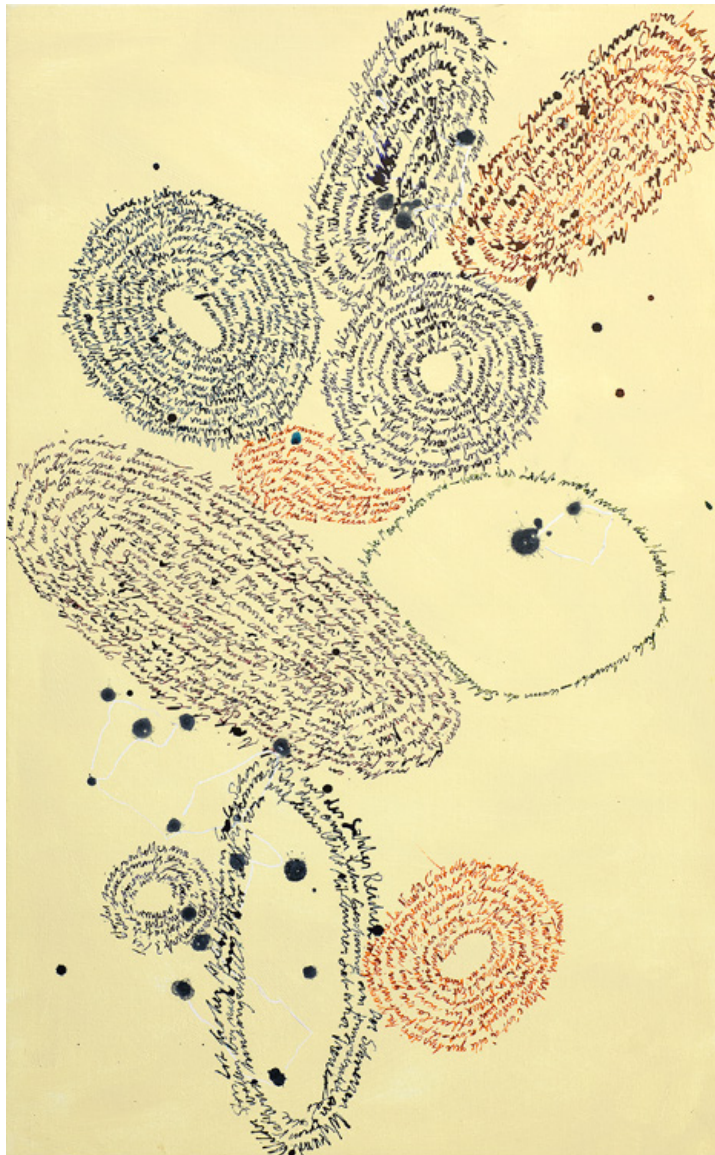
An die Nacht I, tusch på duk © Susanna Slöör